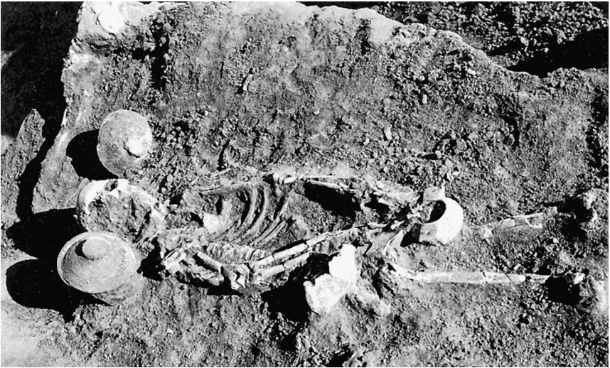
Abb. 2 Das mittellassyrische Grab T. 140 mit einem jugendlichen oder erwachsenen Individuum, mit zwei neben dem Kopf platzierten Keramikschalen, die wiederum von weiteren Schalen abgedeckt werden.

Ein sehr ähnlicher Befund, wie der in den „einfachen“ Gräbern in Mari ist auch in den „einfachen“ Gräbern der Mittleren Bronzezeit in Qatna belegt. Von 36 mittelbronzezeitlichen „einfachen“ Gräbern enthielten zwölf Gräber, also ein Drittel, Keramikgefäße, die auf Speisebeigaben im Rahmen der Bestattung hindeuten könnten. Allerdings ist bei diesen Gräbern in Qatna die Beleglage, aufgrund der wesentlich geringeren Anzahl an Gräbern und dem zum Teil stark gestörten Zustand, schlechter als in Mari. 13 A. Canci und M. Morandi Bonacossi folgern aus den Keramikgefäßen, die als Beigaben in den Gräbern von Qatna platziert wurden, dass „[...] die Beigabe von Essen ein zentraler Bestandteil des Bestattungsritus in Syrien während dieser Epoche war.“ 14 Diese Äußerung ignoriert jedoch die Tatsache, dass sowohl in Mari als auch in Qatna