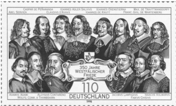
Abbildung 1: Briefmarke der Deutschen Post zu 350 Jahre IPO

wahrlich keine demokratischen Freiheitskämpfer. Von der Gegenreformation ganz zu schweigen.